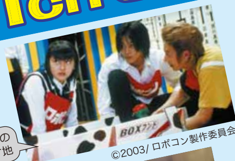
徳山高専など市内の色々な場所がロケ地

誕生20周年を迎えた“ふるさと周南市”をお祝いして、周南市を舞台に制作された映画、周南市の風景をモデルにした映画、周南市のとある場所がロケ地になった映画など、周南ゆかりの作品を CCSの11chで放送します。 お見逃しなく!