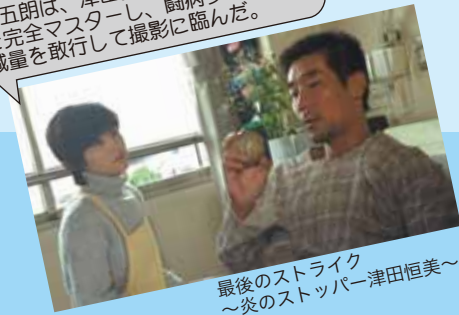
最後のストライク～炎のストッパー津田恒美～